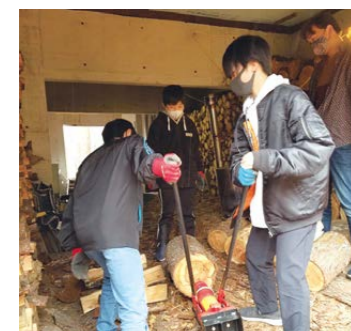
▲薪割機で丸太をどんどん割っていきます

他には、子どもたちの手を借りて、薪割もしました。まだ薪割をしたことがないという男子たち。その楽しさにすっかり魅了された(はず)ようでした。来たる冬に備えもばっちり。まだまだ周辺の草刈りや枝集めなど、仕事はたくさんあります。環境整備に終わりはありません。泣