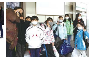
▲新幹線で帰る仲間をお見送り。