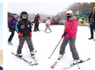
▲皆、大人より上手です。