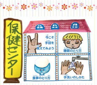
保健センターのページ▲