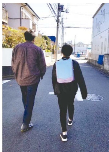
▲次女ちゃんランドセル最後の日の朝

私の戯れ言はFacebookで好評(?)連載中です。次女ちゃんも小学校を卒業しました。2人とも中学生になり、私も小学校のPTAを卒業です。あらたな活動、あらたなつながりが生まれ、ゆめうたも元気に活動中です。と思えば、そうこうしているうちに、アフガニスタンが大変なことに…。報道されている以上に現地は大変です。社会の関心を失ったアフガニスタンの子どもたちの未来が、ますます見えなくなっています。引き続き、活動を続けていきます。応援、よろしくお願いします。もう、これは戦いです…。