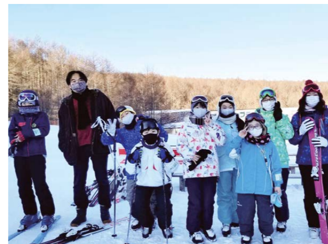
▲快晴の朝、1日楽しくすべります

ネイチャーラボの参加者も、中学生になり多忙で予定が合わなくなってきた子どもの妹たちが参加してくるなど、次の世代にも広がりがあり、子どもたちの成長と時の流れを感じます。コロナ禍でも、どうすれば子どもたちの願いや楽しみが叶えられるのか。こんな時こそ、ゆめうたの出番かもしれません。