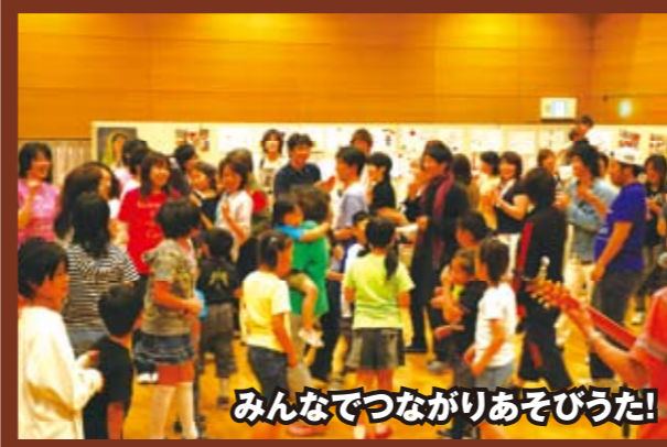
みんなでつながりあそびうた!