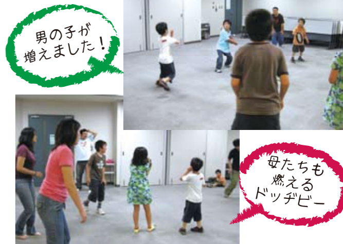
男の子が増えました!

雨でじとじとするものの、すっかりと暑くなってきました。しかし、子どもたちには関係ないですね・・・僕が練習場の準備をしていると、第1陣の女の子組が登場。パソコンをいじっている僕を見るやいきなり「ダンスした〜い!!!」。準備体操がてらにダンス開始。僕も一緒にダンスしたのですが・・・これ、準備運動だね?? 自分もう汗だらだらです・・・そのあと続々と子どもたちが集まってきたところなぜか毎回初対面の方がいるので恒例になりつつある自己紹介をしました。その後にてうたをやりました。ユウマとホノカを見ていると二人ともだんだんと覚えてきてるみたいです。最後にみんなでドッジビー。この日はみんなのことがわかって来たのが一気に近づいた気がします。ただ、ドッジビーの取り合いになるのはご愛嬌ということで。本当ににぎやかになった春日部練習場でした。(小野)