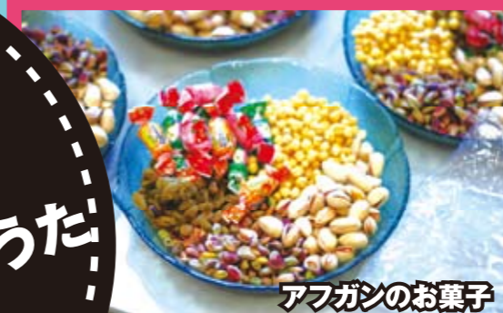
アフガンのお菓子